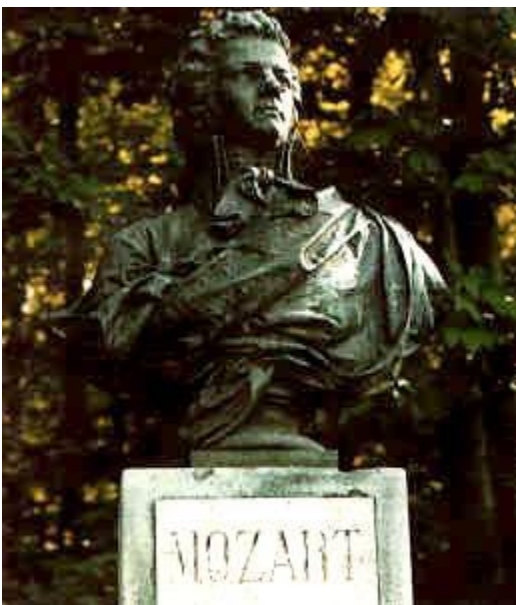
Bức tượng Mozart tại Salzburg, quê hương của ông