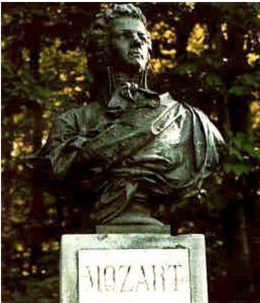
Bức tượng Mozart tại Salzburg, quê hương của ông