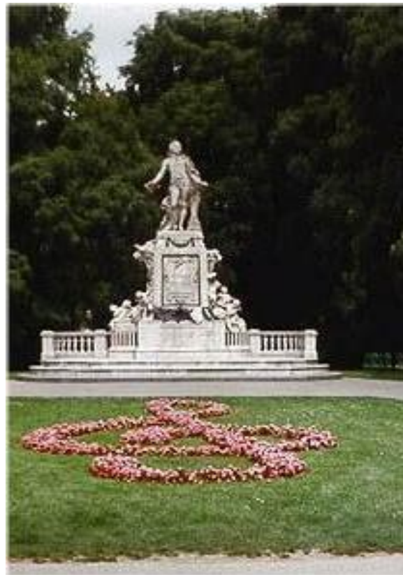
Đài tưởng niệm cố nhạc-sĩ Wolfgang Amadues Mozart tại vườn Burggarten, Vienna.

05 tháng 12 năm 1791 hầu như là do chúng sốt thương hàn nếu không là do thận bị hỏng. Còn có lời đồn rằng Wolfgang Amadeus Mozart đã bị một người bạn đồng nghiệp người Ý-đại-lợi tên Antonio Salieri, cũng là một nhạc-sĩ