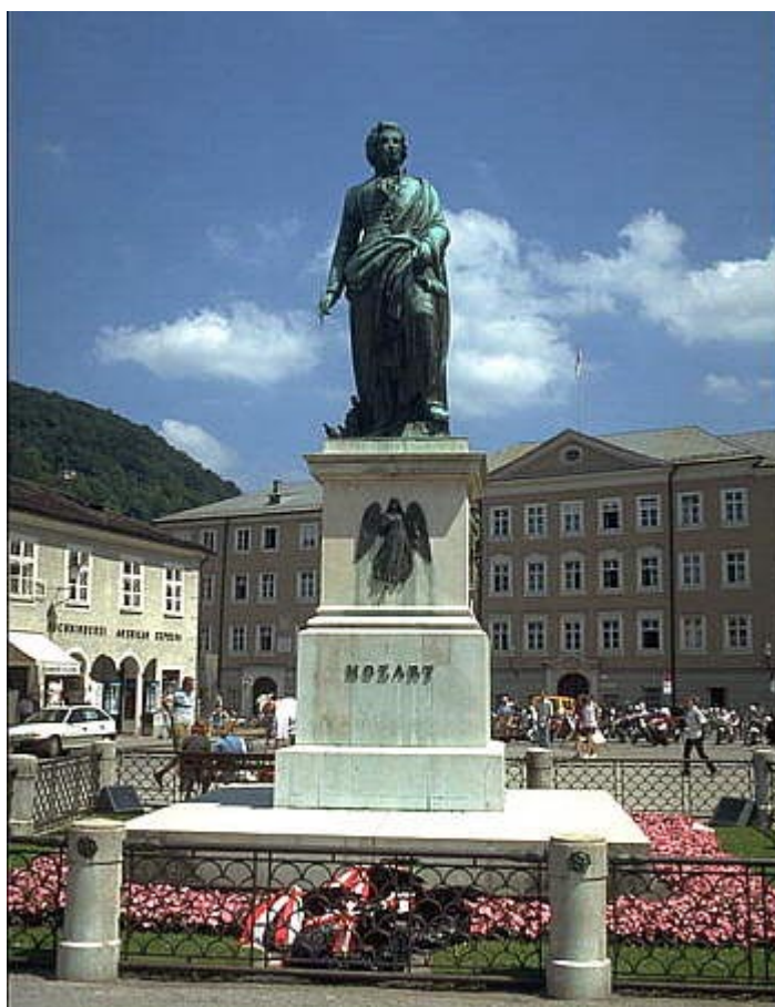
Quảng-trường Mozart tại Vienna

ông vua! Ông Leopold muốn con trai dọn ra sống nơi khác, nhưng lúc ấy đã quá trễ để nghĩ đến chuyện dời chỗ ở vì Amadeus