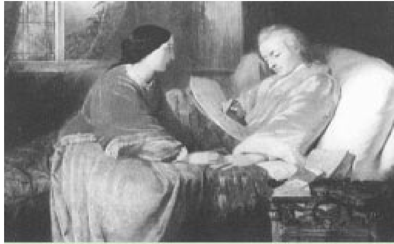
Amadeus Mozart trên giường bệnh, đang cố viết nốt bài nhạc Lễ Cầu Hôn , phu nhân Constance ngồi kề bên.