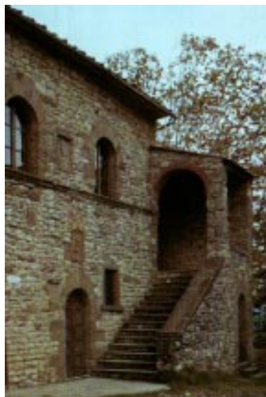
Ngôi nhà tại Capresse, nơi Michelangelo được sinh ra.

ra tại Capresse, nhưng tình cảm của Michelangelo luôn hướng về