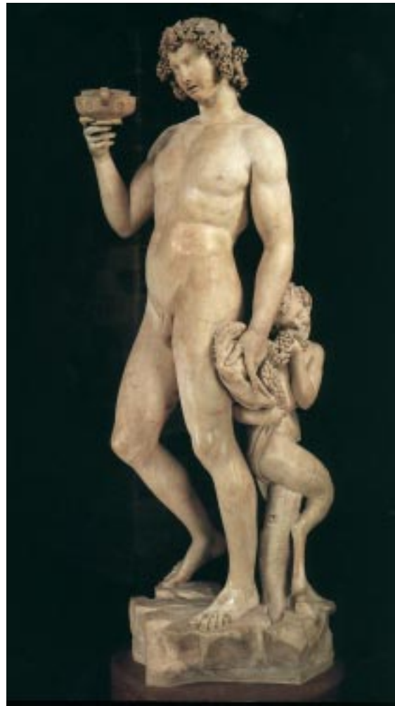
Bacchus (Thần Rượu Bất-Cút, 1496-1498) Đá Hoa, Cao 203 cm Museo National del Bargello, Florence.

Tác-phẩm Pietà , xót xa thống thiết, thanh tú, sắc sảo và tuyệt mỹ đã được Michelangelo trau chuốt kỹ lưỡng hơn cả những tác phẩm sau này của ông! Đức