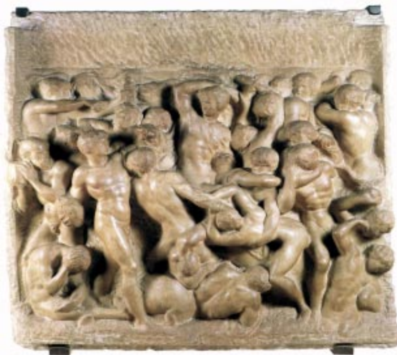
Battle of the Centaurs ( Nhân Mã Vật Lộn ), 1492 Bức Tượng Điêu Khắc thứ nhì của Michelangelo Đá Hoa, 84,5 x 90,5 Cm Casa Buonarroti, Florence, Ý-Đại-Lợi.