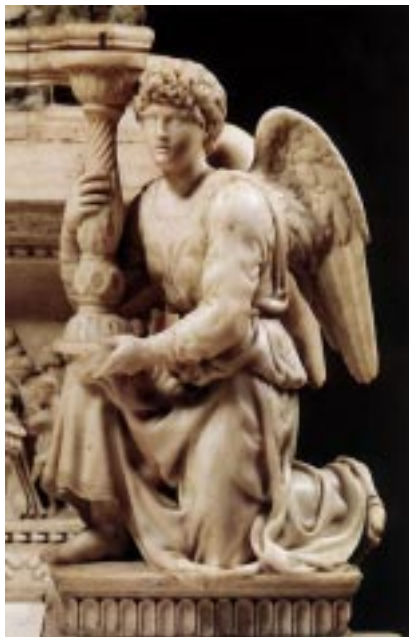
Angel with Candlestick (Thiên Thần Chấu Nến), 1494-95 Tượng Điêu Khắc Cho Lăng Thánh Đa-Minh. Đá Hoa, Cao 51.5 cm San Domenico, Bologna, Ý-Đại-Lợi.

Vào tháng 10 năm 1494, Michelangelo sang Bologna (một tỉnh khác của Ý-Đại-Lợi). Tại đây, ông được ủy nhiệm để thực hiện vài bức tượng nhỏ để hoàn thành Điện-thờ hài cốt của di San Domenico tại Thánh Đường San Domenico Maggiore.