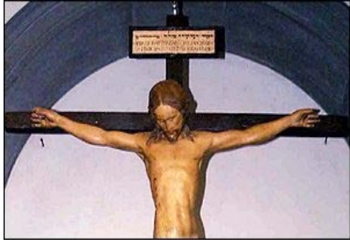
Đức Chúa Giê-Su trên Thánh Giá gỗ, 1493 Casa Buonarroti, Ý-Đại-Lợi.

Thánh Giá bằng gỗ. (Mà hiện nay đang được cất giữ tại Casa Buonarroti để nghiên cứu vì có sự khả nghi rằng, Thánh Giá này không do Michelangelo tạo ra - Nhưng vào ngày 18 tháng 07 năm