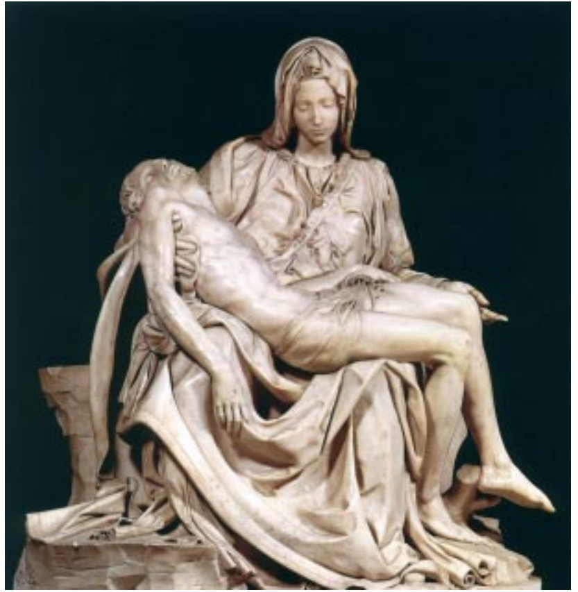
Monument Pietà (Tượng Đức Bà Đau Khổ) 1498-1500 Đá Hoa, Cao 1.74cm, với bục dưới chân, 1.95 cm Basilica di San Pietro, Vatican.

Trình-Nữ Maria với nét mặt thật trẻ được tạc ngồi uy nghi, hai tay đỡ lấy xác con Thiên Chúa nằm ngang qua lòng Mẹ trên vạt áo. Một chủ đề lấy từ ý của nghệ thuật miền Bắc Âu-Châu. Thay vì bộc lộ nét thống khổ cùng cực của một người mẹ phải chứng kiến cái chết của con mình, Mẹ Maria đã kiềm chế lại sự đau đớn một cách thật là chịu đựng! Nét biểu lộ của Người là sự nhẫn nhục, vâng lời chịu phạt, và cam chịu số phận...