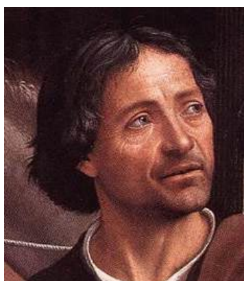
Domenico Ghirlandajo Người Thầy đầu tiên của Michelangelo tại Florence, Ý-Đại-Lợi.

khi Michelangelo cầm bút vẽ thì chú bé liền bị cha và các chú/bác đánh đòn ngay! Tuy nhiên cuối cùng, ông cũng được theo học ngành mỹ-thuật. Vào năm ông lên 13, cha của ông với sự quen biết rộng rãi, đã gởi gắm con trai mình theo học khóa điêu-khắc & hội họa ba năm với họa-sĩ Domenico Ghirlandajo. Đó cũng là người thầy đầu tiên của Michelangelo. Sau này Michelangelo không muốn nhắc đến thời gian theo học