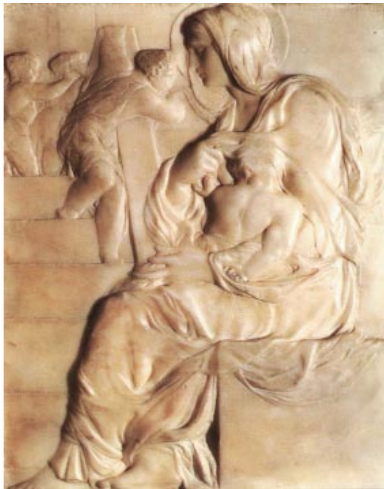
Madonna of the Stairs ( Madonna bên nấc thang), 1490-1492 Bức Tượng Điêu Khắc đầu tiên của Michelangelo Đá Hoa, 55,5 x 40 Cm Casa Buonarroti, Florence, Ý-Đại-Lợi.

Nhưng thật không may cho Michelangelo, Lorenzo de Medici, the Magnificent qua đời quá sớm! Năm 1492, sau khi Lorenzo de Medici mất, ngôi trường ngưng hoạt động và Michelangelo cũng từ từ xa dần gia tộc Medicis. Sau đó, vào năm 1493, Michelangelo được chấp nhận vào học khóa Cơ-Thể-Học ( Anatomy , một môn học bao gồm cả thuật mổ xẻ các xác chết để giúp các họa-sĩ, các điêu khắc gia biết rõ về những cấu tạo của cơ thể, các bắp thịt, các khớp xương, ... của con người) tại một nhà thương nối liền với Sto Spirito. Để tỏ lòng biết ơn về sự ưu tiên đã cho phép ông được hưởng đặc ơn trên, Michelangelo đã tạc tượng một